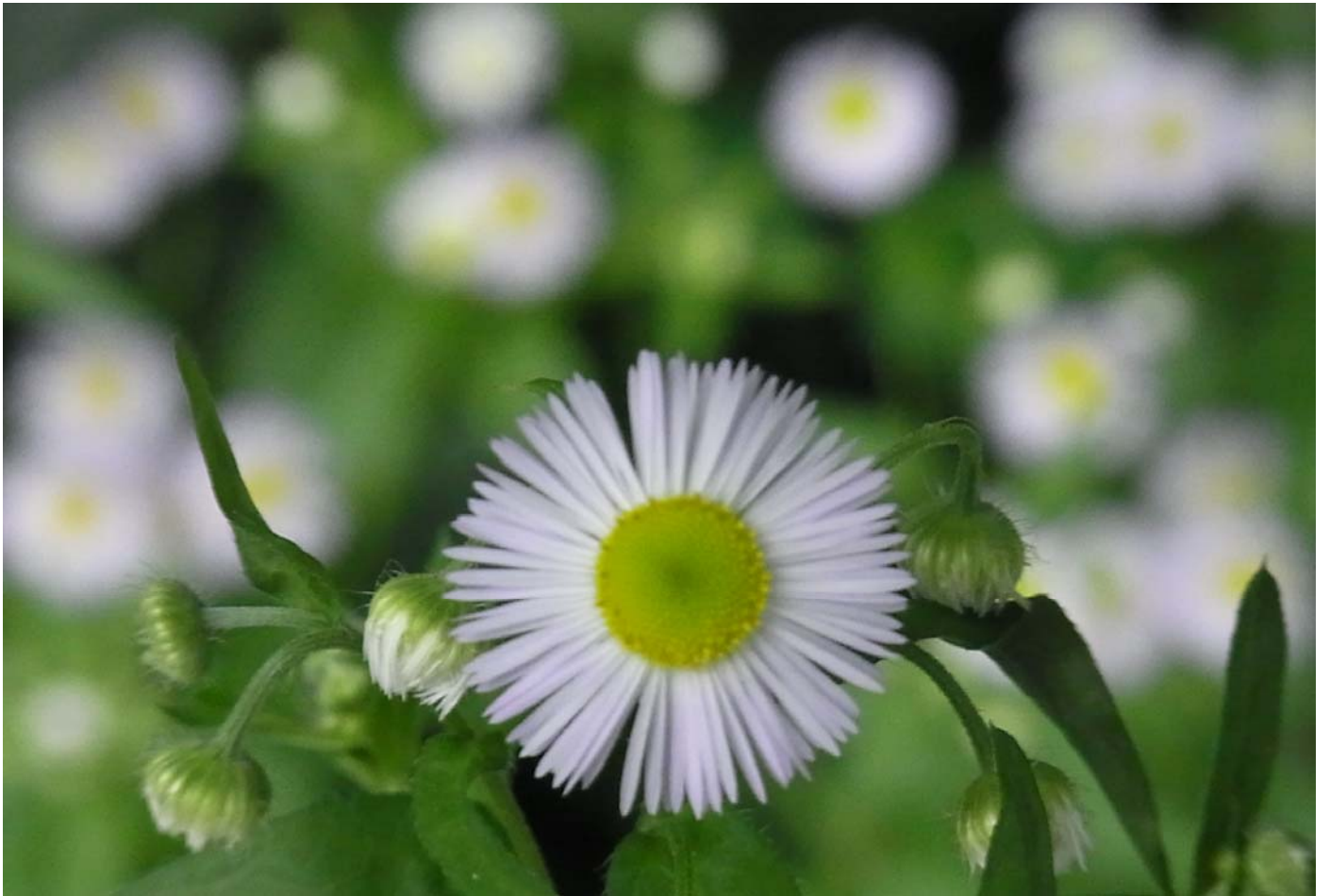
雨降りの時の蝶は撮りやすい、あちこちでヒメジョオン（よく似たのにハルジオンがある）が満開だ。