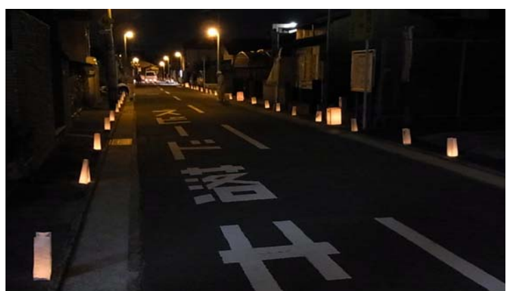
灯明、いろいろな企業、団体、個人の支援で昨年より今年、と成長しているのを感じました。