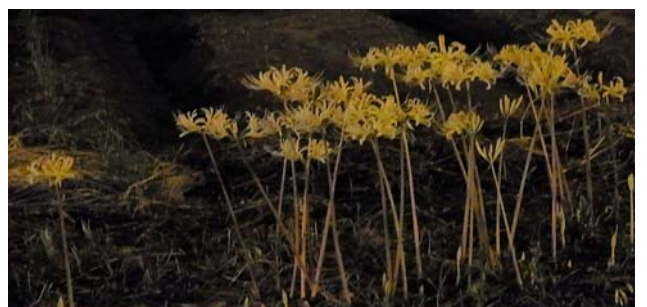
戒壇院、観世音寺も入口から奥まで燈明が並ぶ、彼岸花までしろくなり灯明に花を添える。