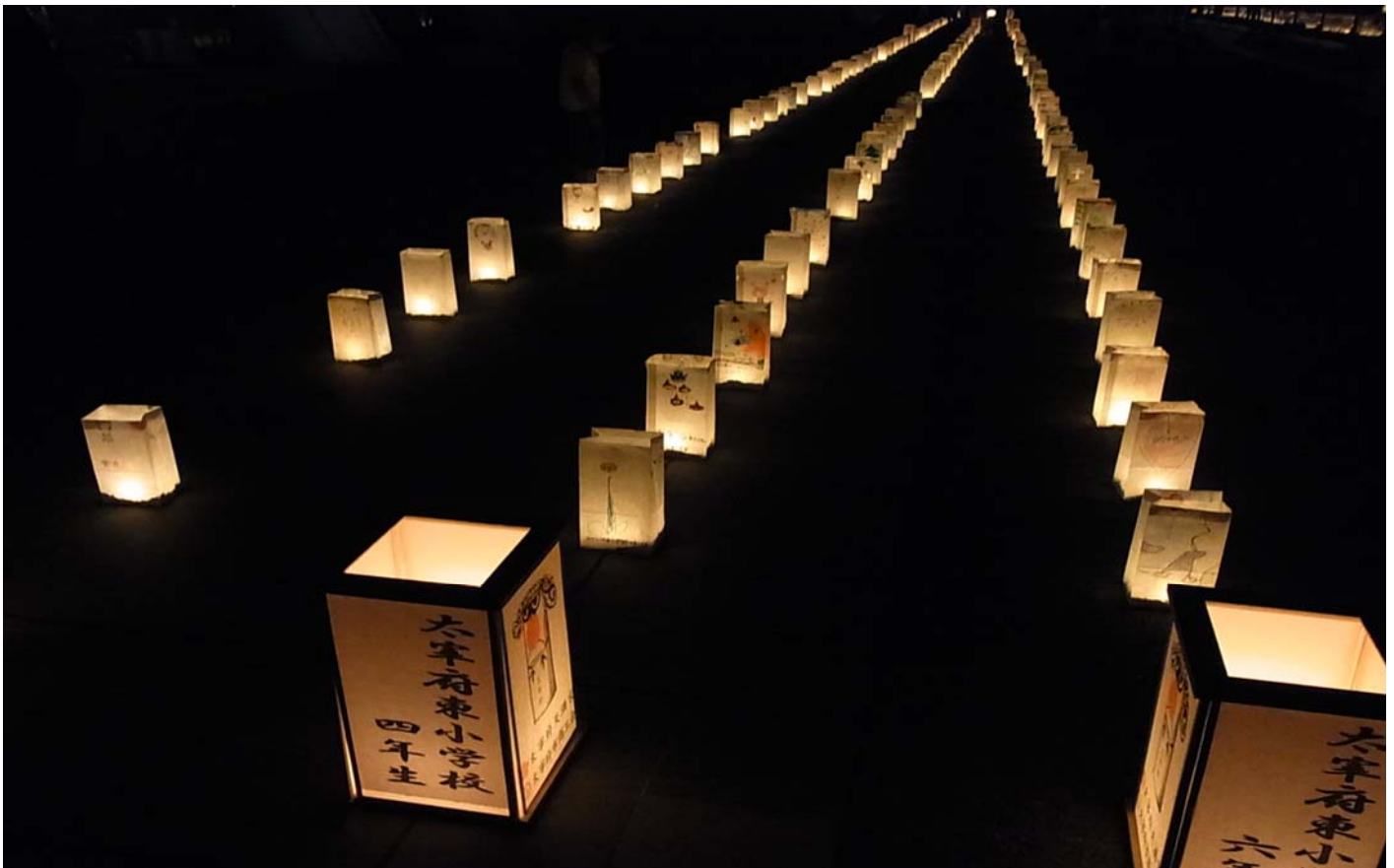
来年もまた期待したい、自分をもっと夜の撮影、腕を上げなきゃ・・・