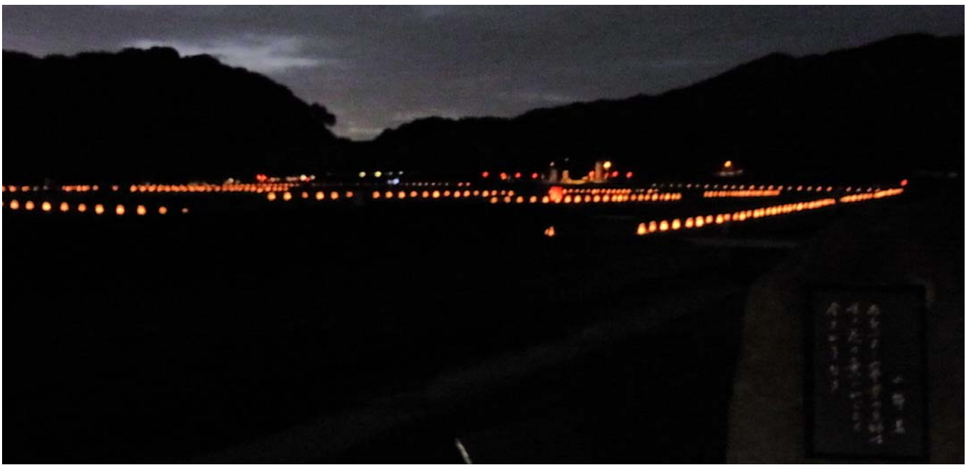
今年初めて、大宰府政庁跡に燈明が並びました。