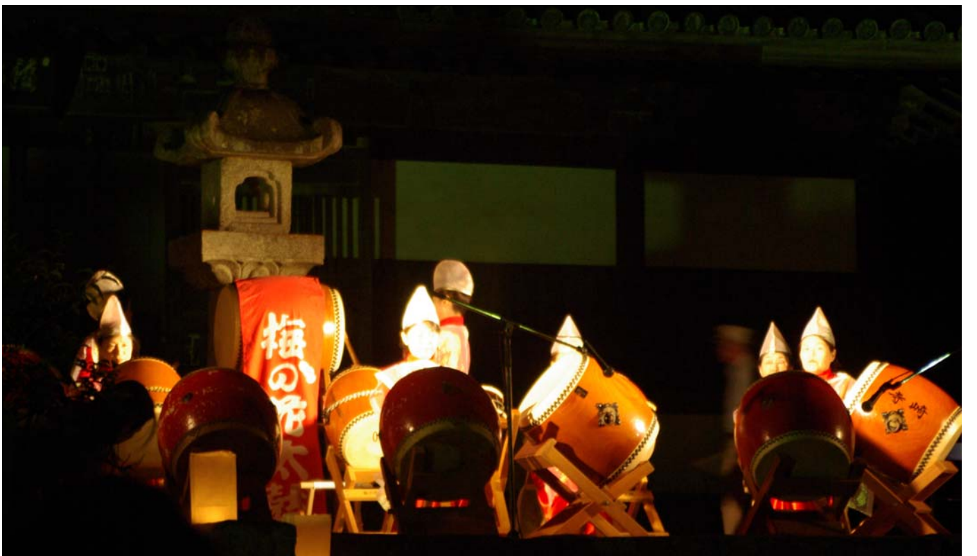
観世音寺では梅の花太鼓、子供たちが演奏していました。