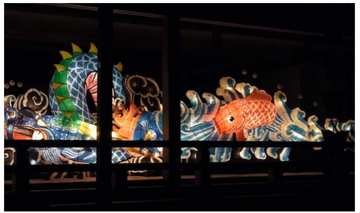
天満宮に奉納されたねぶたも参加していました。九国博物館に着いたころには片づけに入っていました。